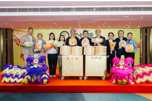
美心集團舉辦萬歲飲茶暨軟心膳發佈會。