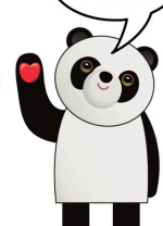
▲“OK仔”與“有心熊貓”這一對IP形象，代表“接納自我”與“友情支持”的理念。