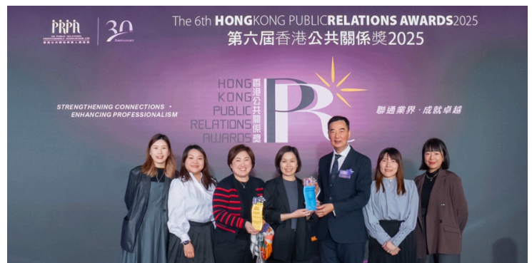
△獲得特別獎「最佳創意獎」予香港麥當勞