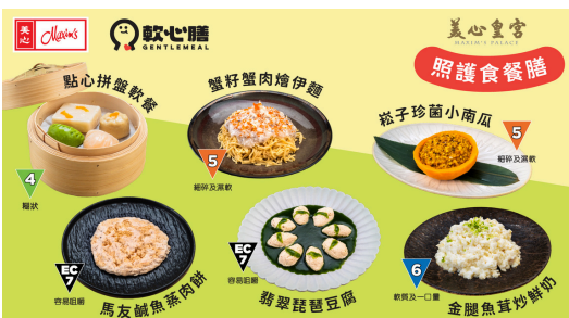
「照護食種子餐廳」荃灣美心皇宮所推出之第5級至第7EC級的照護食菜式。

「軟心膳」產品的製作過程與質量均符合「國際吞嚥飲食障礙標準 (IDDSI)」(第4級) 及本地照護食標準指引，現時售賣的IDDSI等級4軟餐包括中式「點心拼盤」，以及按西式套餐造型製作的「瑞士雞翼飯餐」、「香草雞鎚飯餐」，除了餐點味道受長者歡迎，堂食服務更令患者可以享受與家人同枱食飯的快樂。荃灣美心皇宮亦被香港社會服務聯會認證為「照護食種子餐廳」，推出不同級數國際吞嚥障礙飲食標準的照護食餐膳，讓患吞嚥困難人士可以大眾化價錢享受到色香味美又富