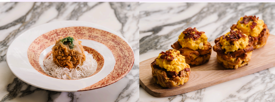
▲部份美心旗下餐廳或分店有售的惜食料理—「吉列牛舌薯波」及「煙肉碎蛋塔」。

企劃主題巧妙地結合「食物」與「環保」的雙重意義，清晰精準地傳達集團在可持續發展領域的舉措。為推動廣泛傳播，企劃將第一階段的創意料理成果做到可見、可嚐，透過鏡頭，把烹飪過程連同食譜拍攝成短片，令「你真惜食！」的理念與實例「入屋」地帶到於每家每戶當中。同時，美心旗下餐廳已推出部分得獎菜式，令公眾亦有機會品嚐及支持惜食味道。社交媒體傳播、門店推廣、新聞報道等有效強化了美心集團「綠色責任、創意美食」的品牌形象。另外，美心與港燈攜手合辦的公眾比賽香港環境及生態局、教育局、環保署、國際廚藝學院、惜食堂及香港航空等單位的積極參與，形成政、