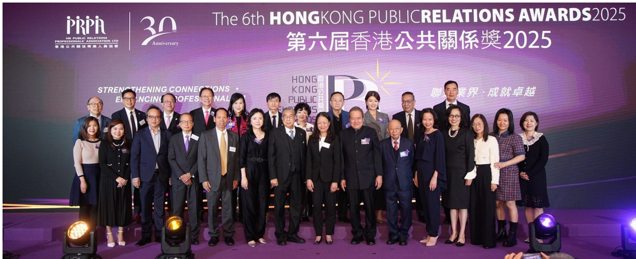
△「第五屆香港公共關係獎2025」圓滿舉行

2025年12月30日，香港公共關係專業人員協會（PRPA）迎來成立30周年的重要時刻，與此同時，備受業界矚目的第六屆香港公共關係獎2025頒獎典禮暨晚宴隆重舉行。