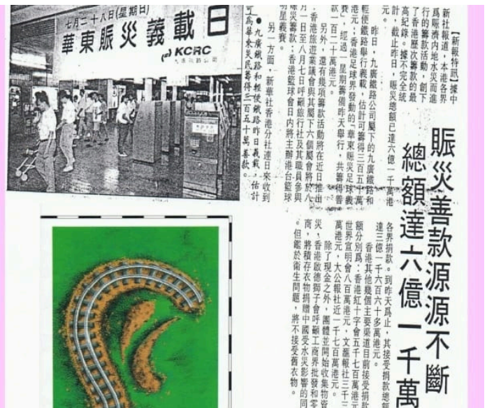
^九鐵華東水災義載日鐵路大堂的籌款箱及有關剪報