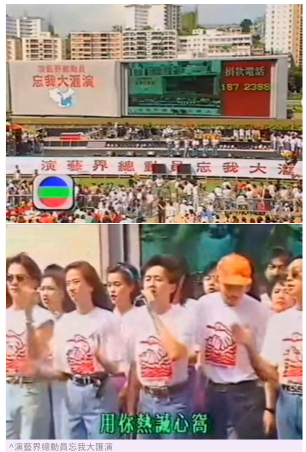
演藝界總動員忘我大匯演

1995年「香港公共關係專業人員協會」(PRPA)第一屆理事會成立，陳祖澤博士一直出任顧問，至今仍不時給我們很大的支持鼓勵與提點。