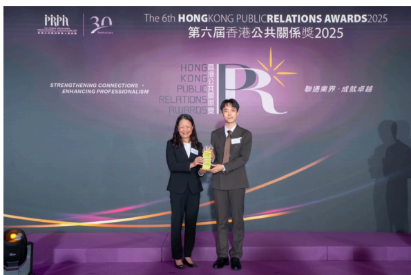
△「公關新星大獎」 - 香港浸會大學 傳播系學生

當中，香港迪士尼樂園度假區的案例榮獲「最高榮譽大獎」，成為本屆最傑出的金獎作品；而香港麥當勞的個案則奪得「最佳創意獎」。資深公關從業員盧炳松先生獲頒「卓越公關專業人員大獎」，以表彰其在業界的傑出表現及重要貢獻。