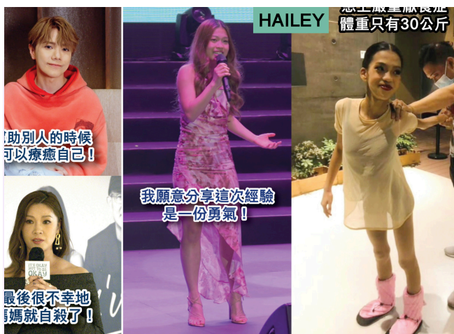
▲邀請真正有經歷、有影響力的“共鳴者”分享如何走出陰霾的故事。

當焦慮與抑鬱成為13.3%香港成年人的日常，當“報喜不報憂”的文化讓情緒困境深埋心底，香港情緒健康學會籌辦《好在有朋友》音樂會，在24年冬天悄然啓動，我們大膽拋棄傳統情緒健康推廣的單向模式，選擇了“音樂會+真實個案分享”這一高共鳴、低抗拒的載體，觸動了這座城市的脈搏。這不是一場普通的演出，而是將專業音樂表演、康復者真實故事、學生合唱團的希望象徵巧妙融合成情感體驗場。當燈光暗下，音樂響起，那些關於掙扎與康復的講述不再是遙遠的案例，而是每個聽眾都可能經歷的生命片段。