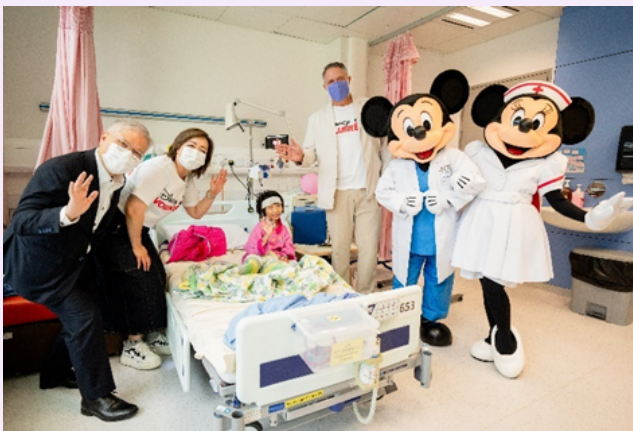
^米奇老鼠及米妮老鼠連同迪士尼義工隊探訪住院病童

香港迪士尼樂園度假區 (香港迪士尼) 關注到住院病童因長期處於醫療環境而面臨心理壓力，因而推出「迪士尼童樂遊」醫院項目，通過迪士尼獨特的魔法體驗，為住院病童及其家庭帶來歡樂與慰藉。項目計劃覆蓋全港八家公立醫院，通過環境升級改造、協助增設娛樂設施及安排義工活動，提升病童的住院體驗，與醫院管理局建設「以病人為本」的下一代醫院的願景高度契合。