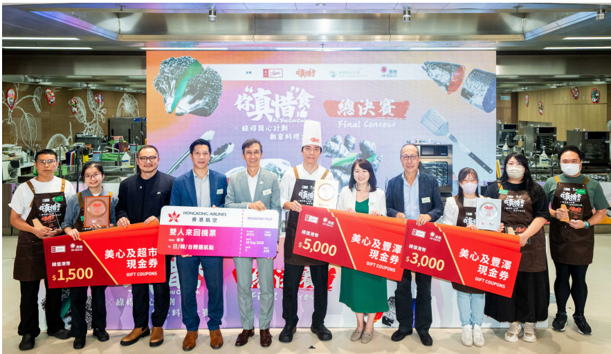
▲「你真惜食！」創意料理大賽總決賽頒獎典禮。

「你真惜食！」企劃在提升品牌形象、擴大社會影響力及促進環保減廢方面均取得亮眼成果。