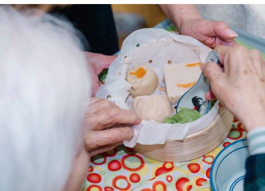
護理院長者正在食用軟心膳點心拼盤。

營養的照護食餐膳。美心亦為不同院舍長者舉辦多場節慶、送餐及探訪活動，並邀請政、商、社福界持份者參與，提升關注，將「軟心膳」及照護食的關懷理念拓展至更深更廣。