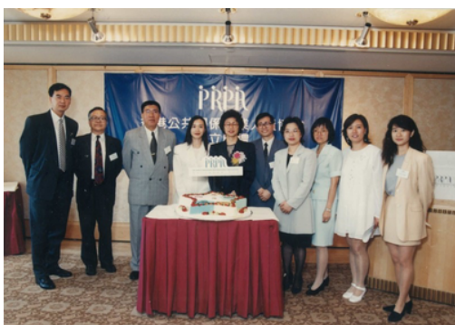
△ PRPA首屆執行委員會就職典禮（1995年7月8日）

創業艱難，守業更不容易。環顧香港的社團組織歷史，鮮有社團組織，能夠順利健康成長達30年。PRPA 蕪路藍縷，30年一路走來，尚算不負眾望。盼望協會所有成員，繼往開來，同心同德，在下一個十年，以至再多的十年，能夠為會務不斷開創新高峰。