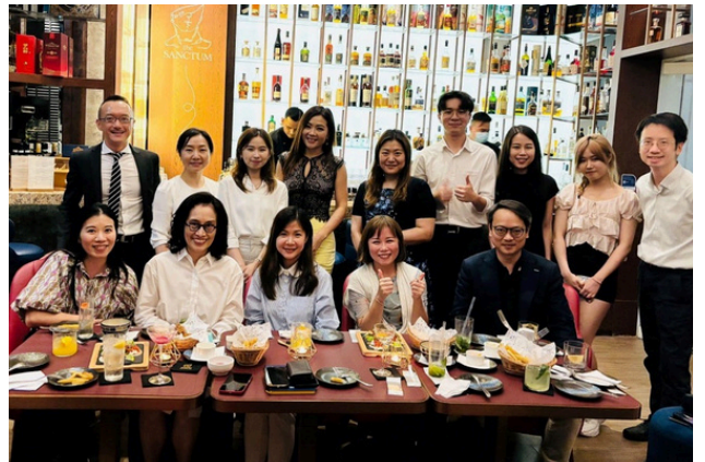
△ 新舊會員共聚一堂，分享公關心得。

PRPA日後將舉辦更多不同形式的交流活動，促進會員之間的溝通，凝聚行業力量，推動公關專業持續發展。