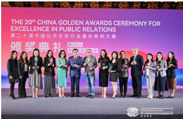
△ PRPA代表聯同部分香港區獲獎公司代表出席於北京舉行的「第二十屆中國公共關係行業最佳案例大賽」頒獎典禮。

PRPA 連續 13 年獲大會頒發「組織獎」，表揚協會於業界的貢獻和努力。中國公共關係行業最佳案例大賽自 1993 年創辦以來，受到了眾多全球 500 強企業、中國政府部門以及公共關係專業機構的積極響應。大賽旨在搭建交流學習的平台，匯集業內同仁的聰明才智，推動更多優秀公關公司做大、做強、做精，鼓勵其承擔更多的行業責任和社會責任。