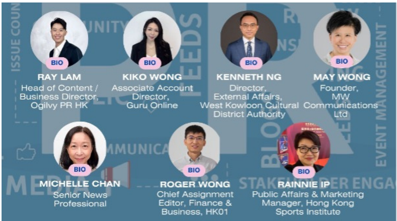
△ 「Executive Certificate Course in Unlocking PR Essential Toolbox」課程中的講者

課程將於2025年2月26日開課，立即報名： https://www2.hkma.org.hk/short/CF-80176-2025-1-P/