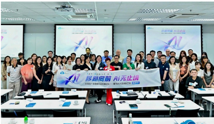
△ 「大灣區廣告營銷行業發展論壇」在香港圓滿舉行。

在香港舉辦此論壇之前，「TMA (Top Mobile & AI) 大獎」已先後在北京、上海、廣州成功舉辦了三場交流巡講會，邀請了來自中廣融信、迪思傳媒、明略科技、科大訊飛、知萌、司數科技、鈦鉑新媒體、NPLUS 等優秀企業的十多位業界專家分享，累計吸引近 200 位嘉賓到場交流學習。