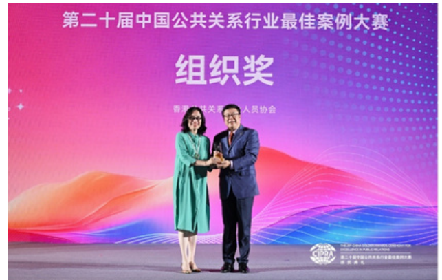
△ PRPA連續13年獲大會頒發「組織獎」，表揚協會於業界的貢獻和努力。