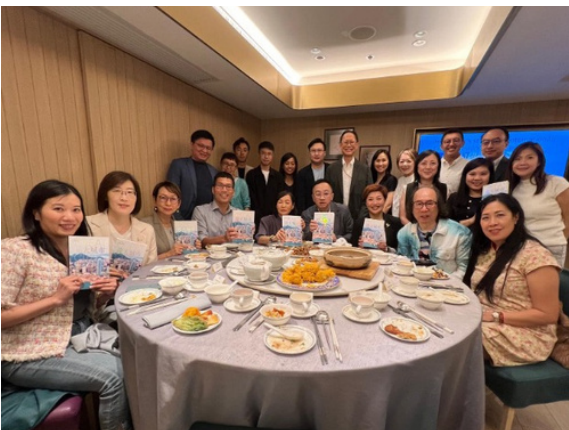
△ 《偉大城市》新書分享會座無虛席。