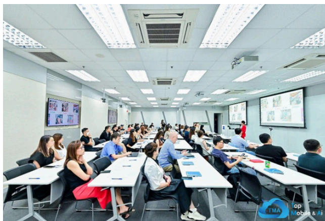
△ 論壇促進內地和香港營銷行業的共同發展與交流。