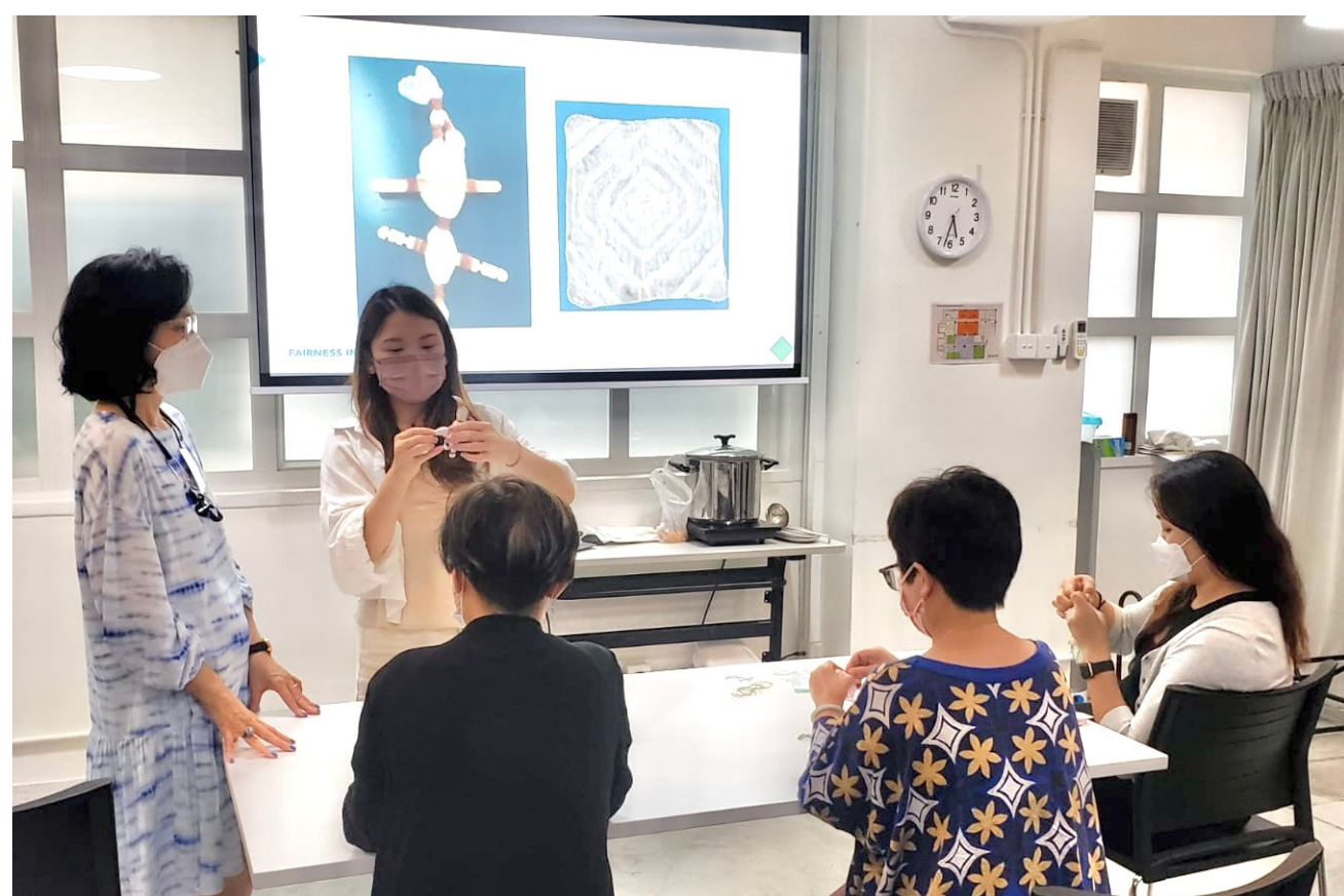
▲ PRPA會員一同學習咖啡渣紮染方法。

首先，以橡筋紮起白色手帕，被紮起的部分便不會碰到染料，成為漂亮的花紋。然後，把手帕浸