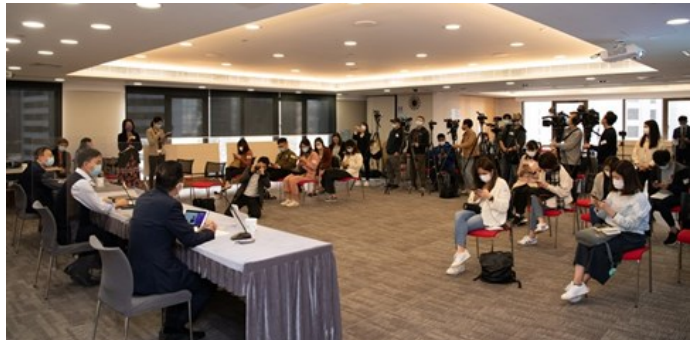
▲ 研討會吸引不少傳媒朋友到場採訪

人士，都建議大家接受疫苗注射，但如果接種時有傷風感冒症狀的話，由於未能確定注射當刻是否感染新冠肺炎，醫生建議先不要注射。如果有人不幸患過新冠肺炎，醫生建議可稍等三至六個月才接受注射。回應一系列問題後，會上兩位醫生都不忘建議市民應接種疫苗，因為只有越多人接種，才可以達致群體免疫的效果，那麼大家才可以慢慢脫離戴口罩和社交距離等措施，重返以往正常的生活。