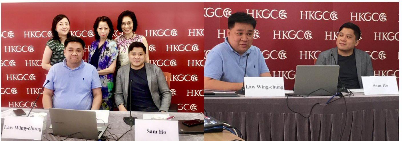
▲ 「實務數碼公關」為今年 PRPA 與香港總商會合辦的壓軸工作坊，內容充實緊貼社會最新趨勢