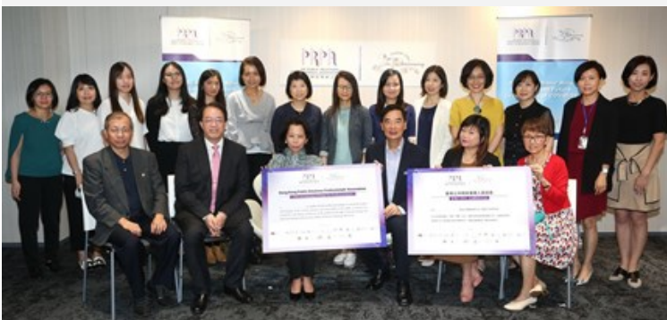
▲ PRPA 藉著首個網上研討會推動香港首個「公關專業承諾」，提升行業的專業水平。