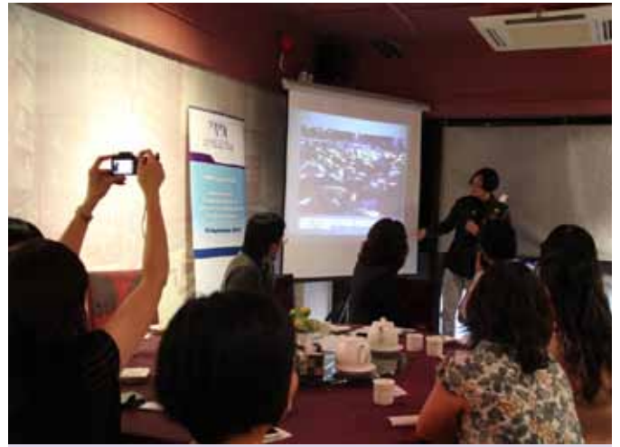
▲ 出席的公關專業人員聽得十分投入

將新聞元素集中於同一位置，並在同一段時間出現。他坦言，大部分公關活動的拍攝環節安排都在活動尾段進行，令不少工作繁忙的攝記，因要趕往採訪下一個活動而提早離開，錯失最好的拍攝時機。他建議，可考慮安排拍攝環節在活動開頭或中段，以確保活動最美好的時刻能被攝入。