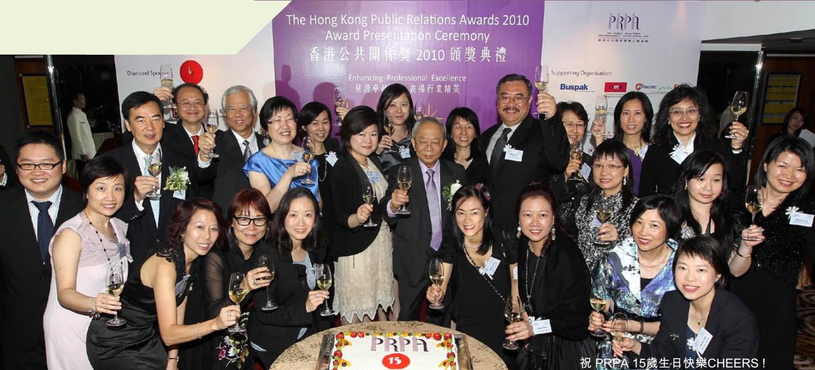
祝 PRPA 15歲生日快樂CHEERS!