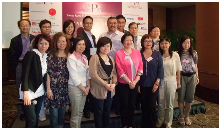
分享嘉賓及本會委員合照

香港電腦通訊節自2004年舉辦以來，是眾多電腦供應商必爭之地。凱旋先驅為客戶「聯想」在2010年電腦博覽會中創造了全方位的整合營銷活動，率先在博覽會中限量推出皇牌產品（Hero Product）造勢，在展區以NO.1為裝置主題，加強視覺效果及引起關注。活動還涵蓋傳統媒體發放及網絡宣傳，並在展區與觀眾直接互動，別具創意。結果傳媒報道比去年增加250%，92%的關鍵信息成功傳播，活動期間facebook上的支持者增加了20%以上，銷售目標也達成。