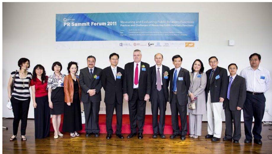
▲ 一眾會議講者及支持機構代表於會議開幕典禮上留影。