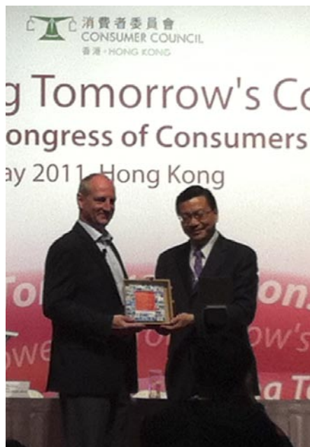
▲ 比利時國際消費者研究及試驗組織總幹事 Guido Adriaenssens(左)分享CSR調查方法

工，其後在公司年報表明會更嚴格要求供應商履行社會責任。她進一步指出蘋果、沃爾瑪和Nike這類公司，由於供應鏈長，涉及多個國家數以百計的供應商，有能力創造新的共同價值(shared value creation)，推動整個行業改變。