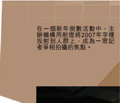
在一個新年倒數活動中，主辦機構用射燈將2007年字樣投射到人群上，成為一眾記者爭相拍攝的焦點。