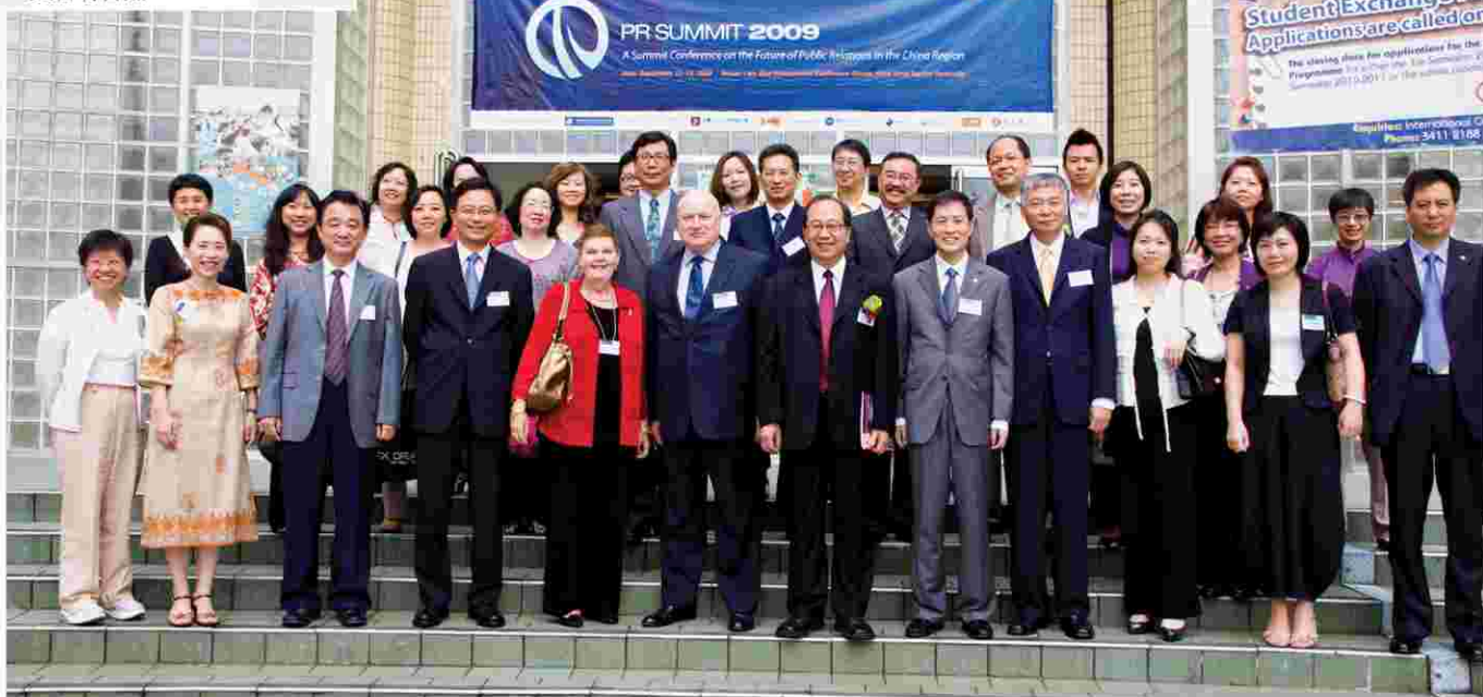
「中國公共關係的發展趨勢與未來走向」高峰會議講者嘉賓與部份與會者合照