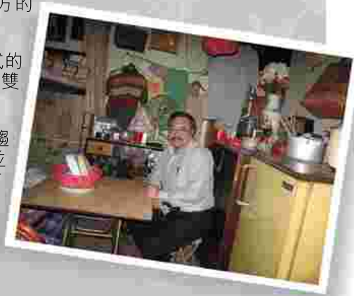
▼坐在舊區生活探索展館的斗室中，令我憶起小時候的生活

精彩的會員活動亦帶來了多篇精彩的報道，有賴傳媒關係及出版委員的精心策劃，以及幾位熱心撰文的會員和學生付出的努力，謹此致謝。✘