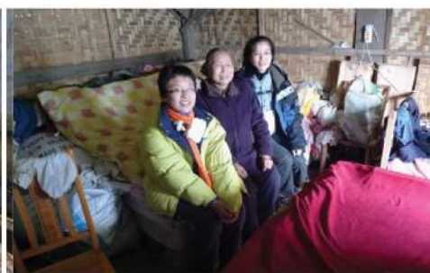
何婆婆(右二)對香港義工感道來訪，喜極而泣。