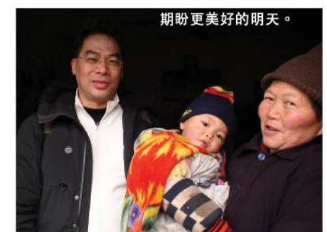
期盼更美好的明天。