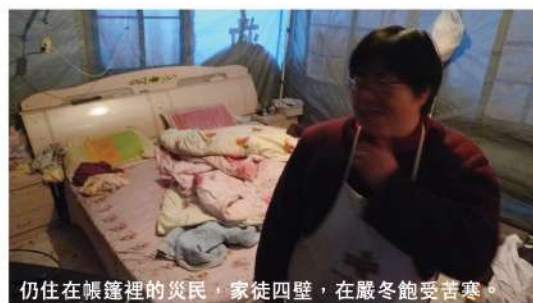
仍住在帳篷裡的災民，家徒四壁，在嚴冬飽受苦寒。