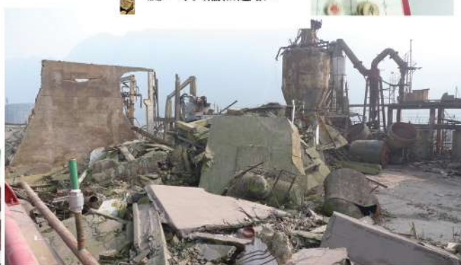
都江堰市破壞嚴重，超過一萬人死亡。