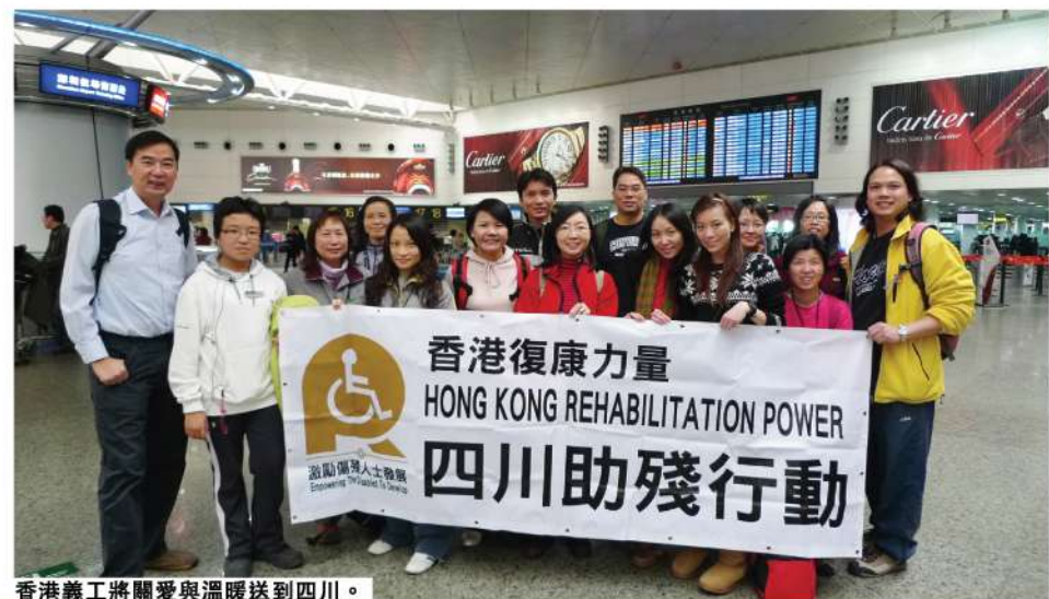
香港義工將關愛與溫暖送到四川。