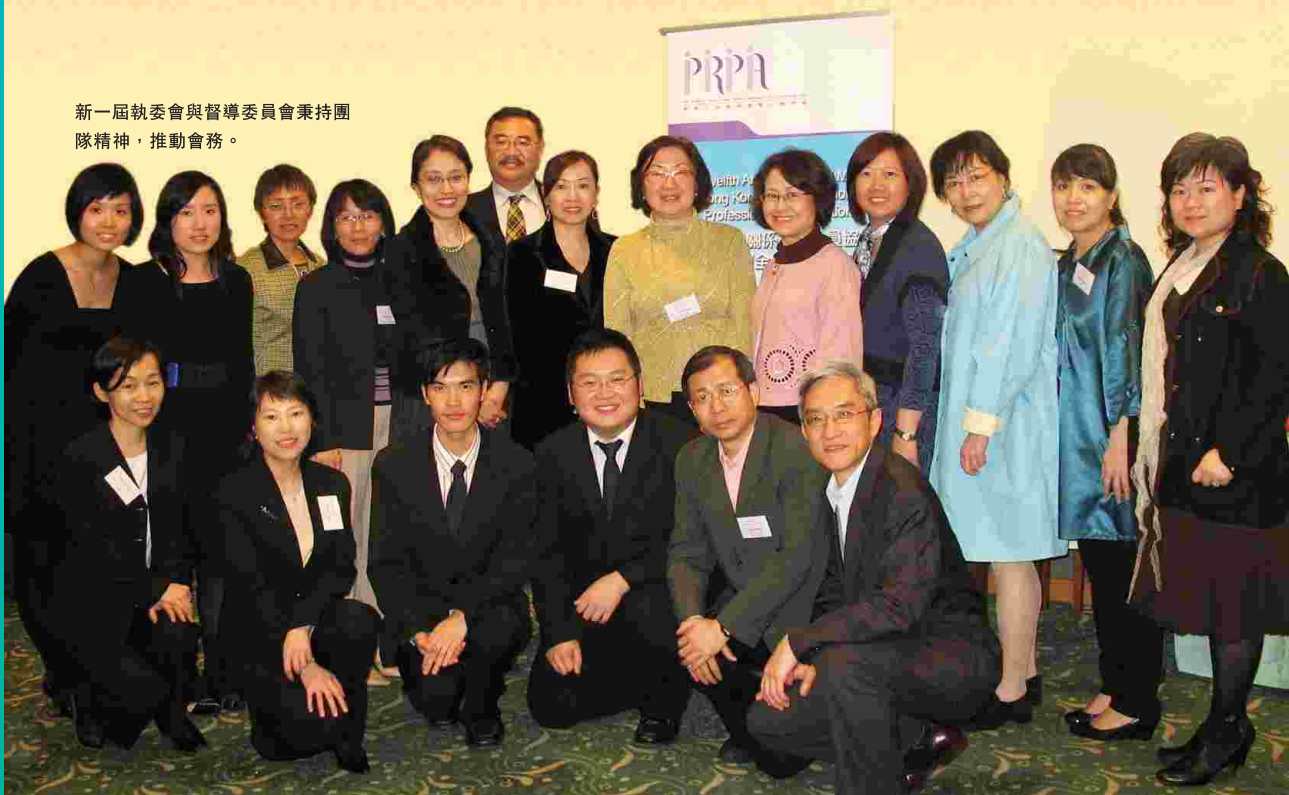
新一屆執委會與督導委員會秉持團隊精神，推動會務。