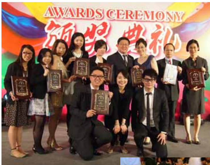
香港獲獎公司 代表合照

5月25日晚，第11屆中國最佳公共關係案例大賽頒獎典禮在北京麗晶酒店成功舉辦。來自中國外交、新聞、商務等領域的重要嘉賓以及國際公關組織負責人、國內外著名公關專家和學者約400人聚首一堂，共同見證了這一行業盛典。